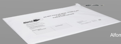
P143CB Alfombra pequeña para cama