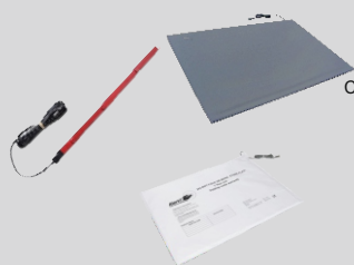
Conexión por cable