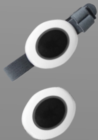
P193AA Pulsador aviso

El detector de presencia ALERT-IT permite monitorizar a los pacientes de una habitación, detectando si alguno de ellos se ha movido. Puede colocarse en diferentes lugares de la habitación (pared, a ras de suelo, etc.), de tal manera que es posible configurar el dispositivo para que detecte diferentes tipos de movimientos.