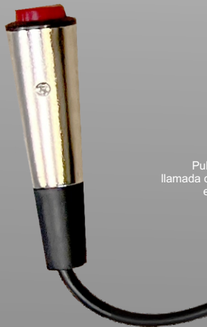
P156T Pulsador de llamada con cable en espiral