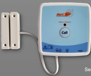
P163AA-D Sensor avisador para puerta

Los pulsadores ALERT-IT permiten al usuario enviar una señal de aviso al cuidador simplemente apretando el pulsador. En el caso del modelo anticaída, además de la función de aviso, el pulsador es capaz de detectar si el usuario se ha caído y de mandar en ese caso una señal de aviso al cuidador.