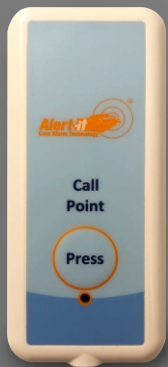
P176B Pulsador de llamada