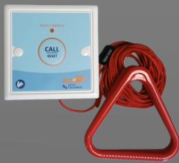
P209A Tirador aviso emergencia cuarto de baño

El sensor avisador para puerta permite detectar cuándo un paciente está intentando salir de su habitación. Una vez abierta la puerta, el sensor envía una señal al receptor del cuidador para que éste acuda.