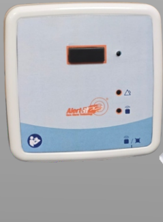
P210AA Detector de presencia