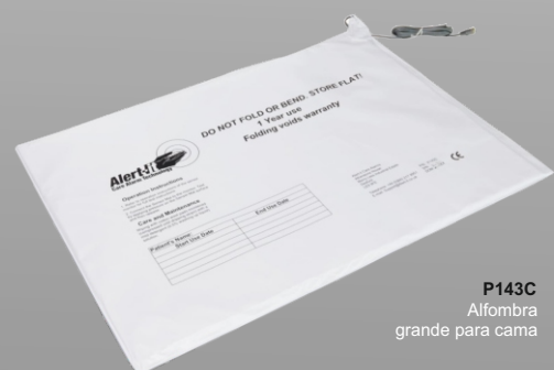
P143C Alfombra grande para cama

La medida de la tira sensor para silla es de 40 cm .