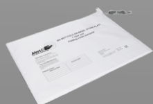
P149A Alfombra avisadora para silla